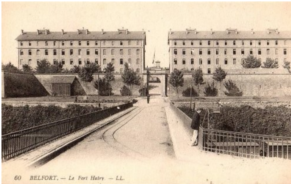
60 BELFORT. — Le Fort Hedy. — LL.

Le mémorial des fusillés de Saint Symphorien avec la liste des noms: