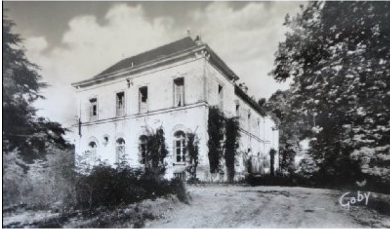
Siège de la gestapo à Tours ou Yvette a été torturée: